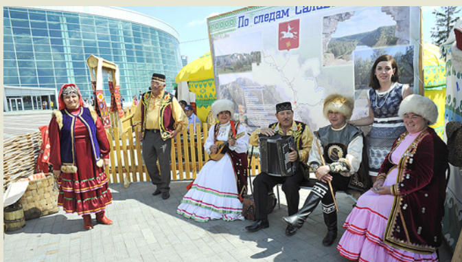
Гостеприимные аркауловцы готовы встретить почетных гостей