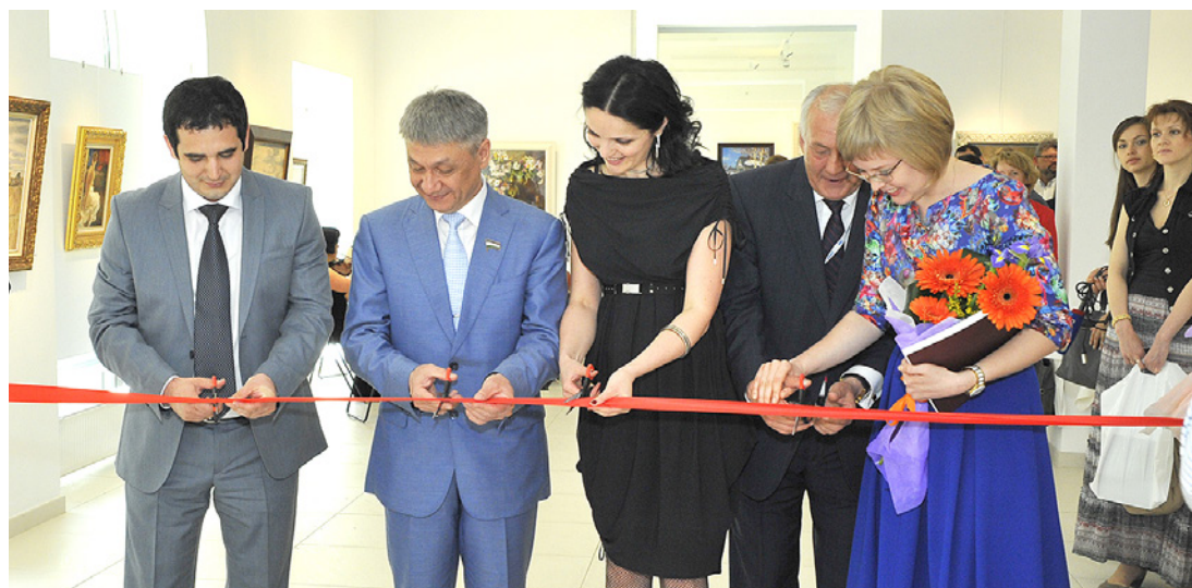
Открытие выставки картин «Вековые традиции»