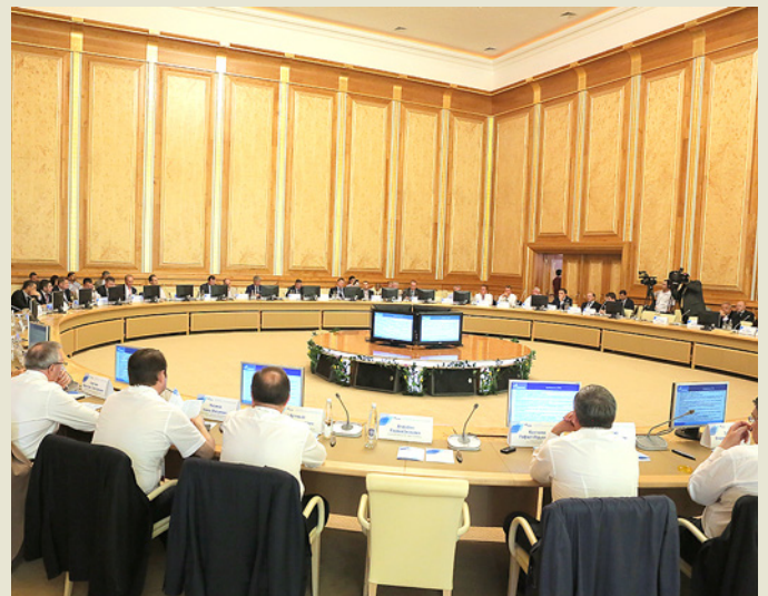
Обсуждая вопросы надежности ГПА и приводных двигателей