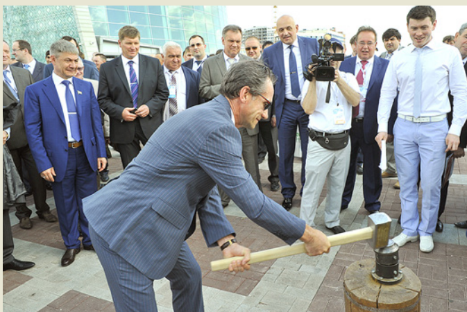
Чеканка юбилейной монеты