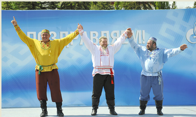
Ведущие стронгмены России на празднике газотранспортников