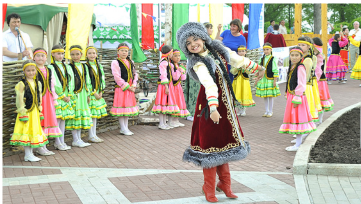
Яркий сабантуй украсил праздник

«ГАЗПРОМ ТРАНСГАЗ УФА» НАЧАЛ ОТСЧЕТ СЕДЬМОГО ДЕСЯТИЛЕТИЯ