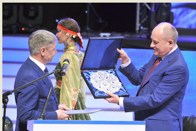
Подарок коллективу Общества от ОАО «Газпром»