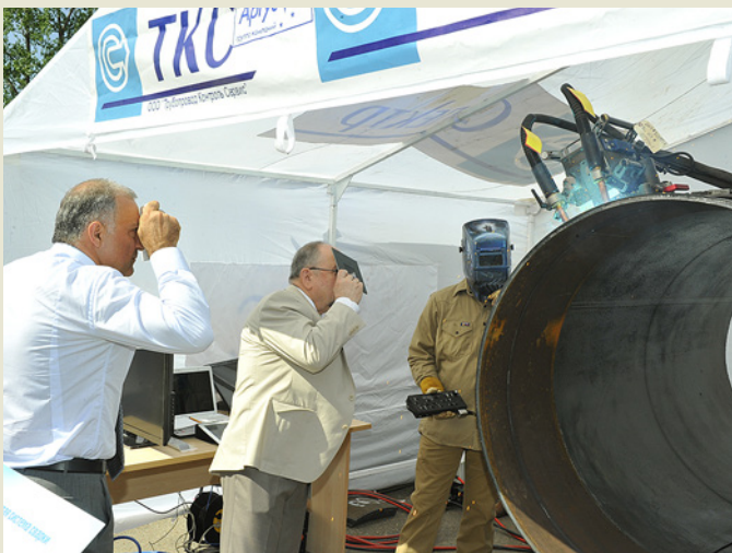
Производственная экскурсия в ИТЦ