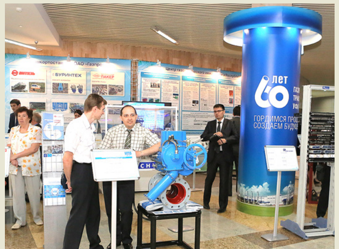
На выставке промышленных достижений представлено 20 организаций