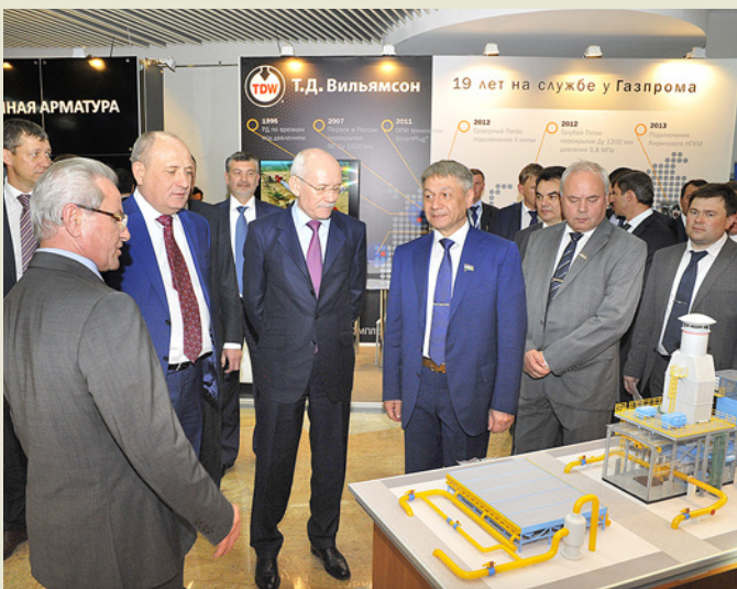
Рустэм Хамитов знакомится с техническими достижениями