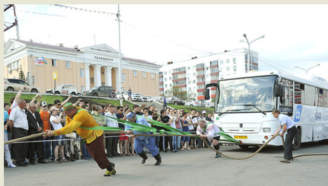
В финале силачи совершили совместную буксировку автобуса