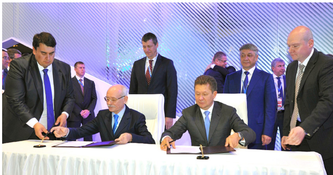
Р. Хамитов и А. Миллер на подписании Соглашения

В северной столице прошел Петербургский международный экономический форум 2014, в рамках которого Президент Башкортостана Рустэм Хамитов и Председатель Правления ОАО «Газпром» Алексей Миллер подписали дополнительное соглашение к Соглашению о сотрудничестве между Правительством РБ и газовым концерном.