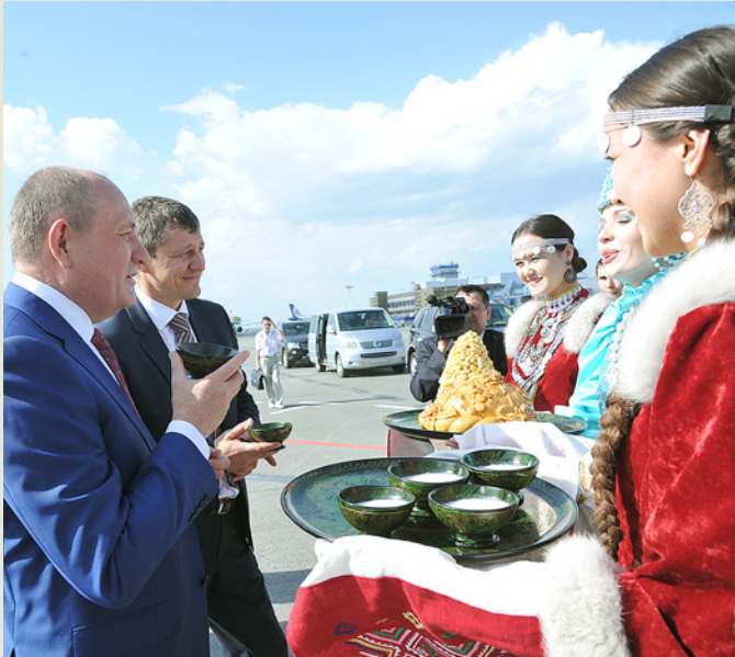
Встреча в аэропорту