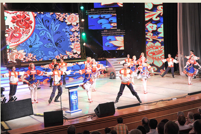
Выступление артистов на концерте