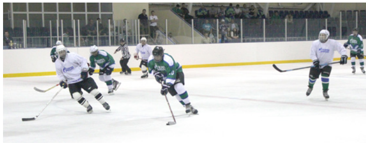
Во время матча шла напряженная борьба

– Хоккей – командная игра , – отметил заместитель генерального директора – главный инженер Обще-