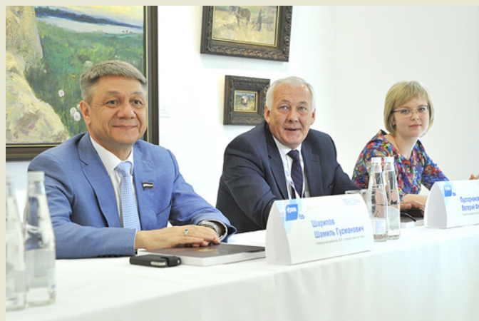
Открытие выставки картин «Вековые традиции»